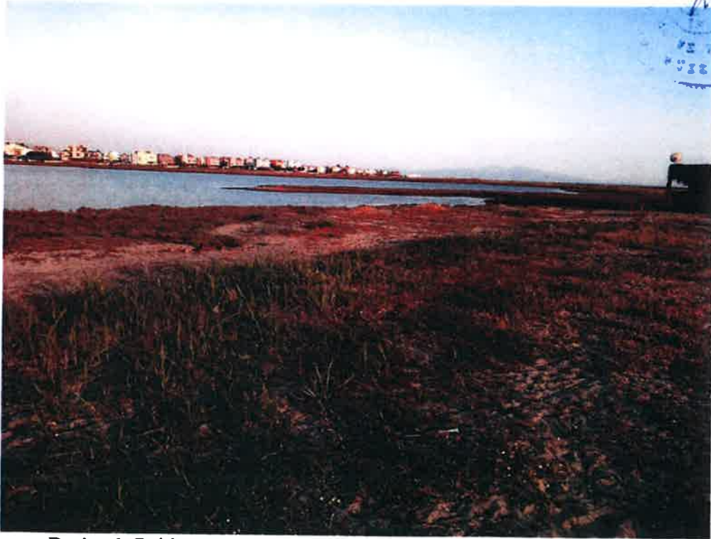
Resim 6: Balıkçı Barınağı Alanında Doğal Kumluk Dalgakıran Yapısı.