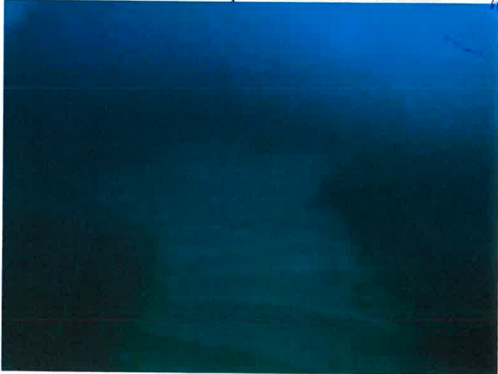
Resim 2: Batık Araması Yapılan Alanda Sualtından Görünüm.