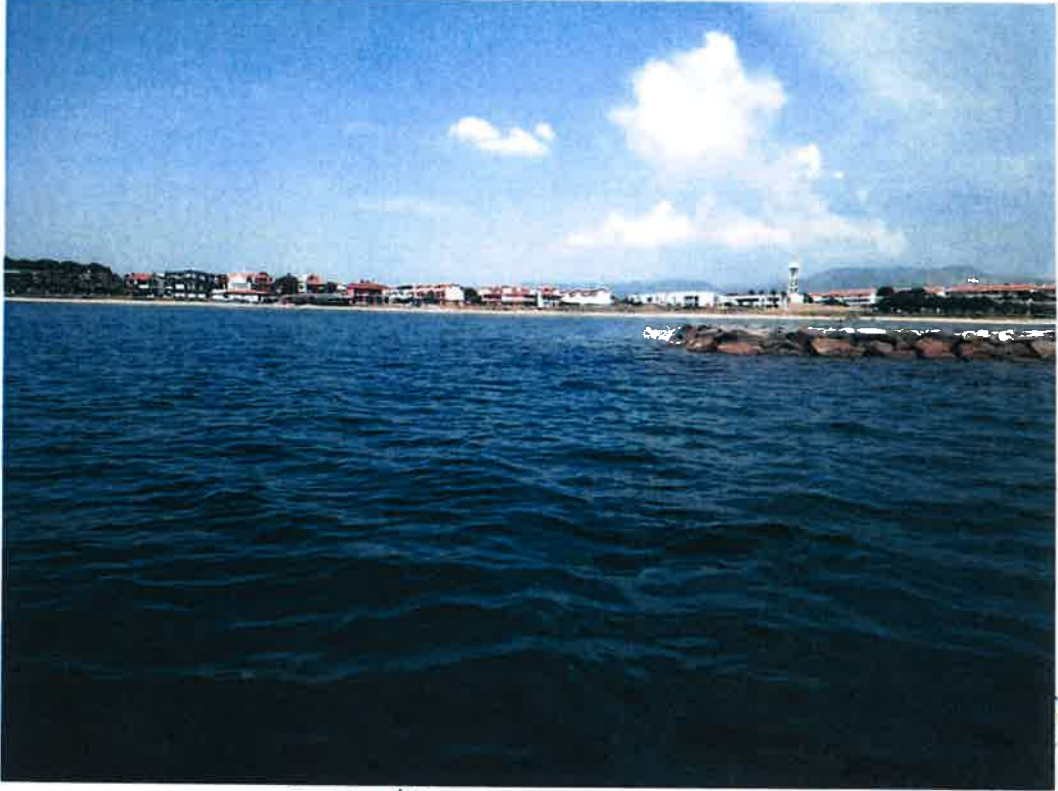
Resim 3: Kadirga İskelesi? Alanının Denizden Görünümü.