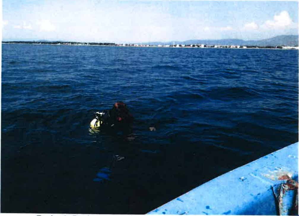
Resim 1: Batık Araması Yapılan Alanın Denizden Görünümü.