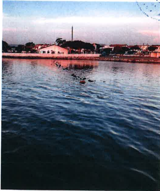
Resim 6: Balıkçı Barınağı Alanında Su İçerisindeki Taş Dizisi.