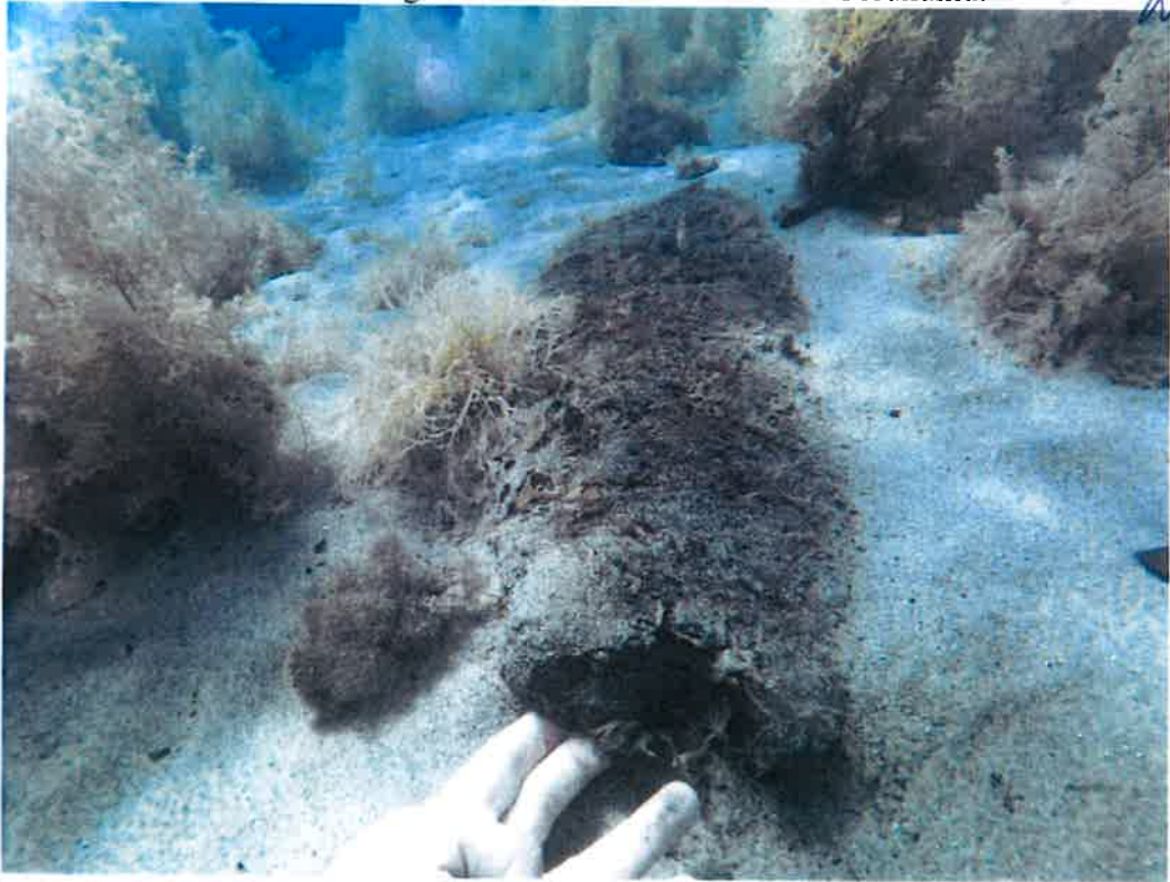
Resim 4: Kadirga İskelesi? Alanında Sualtıdan Ahşap Kalıntı.