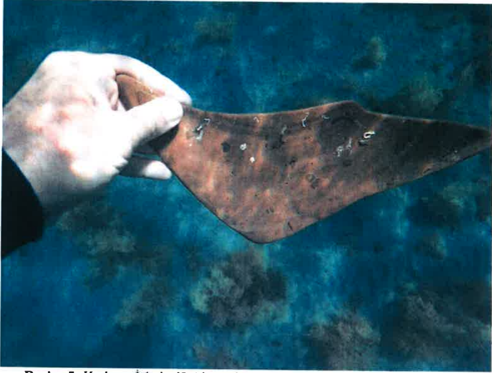
Resim 5: Kadırğa İskelesi? Alanında Sualtıdan Amphora Parçası.