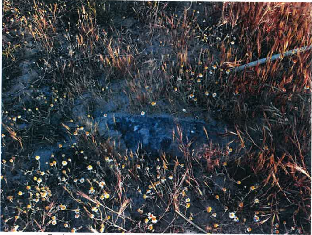
Resim 7: Doğal Kumluk Dalgakıran Yapısı içindeki Taş.